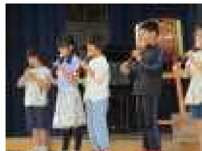
3年生のリコーダー奏