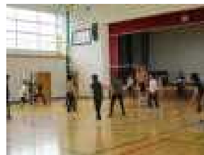
ソフトバレーの様子