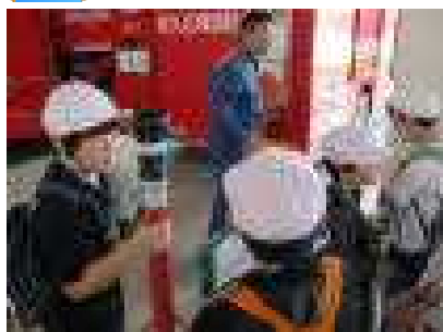
佐久消防署での様子

6月18日（火）4年生の社会科見学があり、佐久消防署とクリーンセンターに行きました。消防署では実際の活動の詳しいお話をお聞きしたり、消防車等の近くに行ってお話を詳しく見たりすることができました。クリーンセンターでは、焼却の仕組みだけでなく、ゴミの分別などの大切さについても学びました。現在、佐久市では新しいセンターを建設中ですので、現在のセンターを見ることができるようにもあとわずかですから、貴重な見学でした。